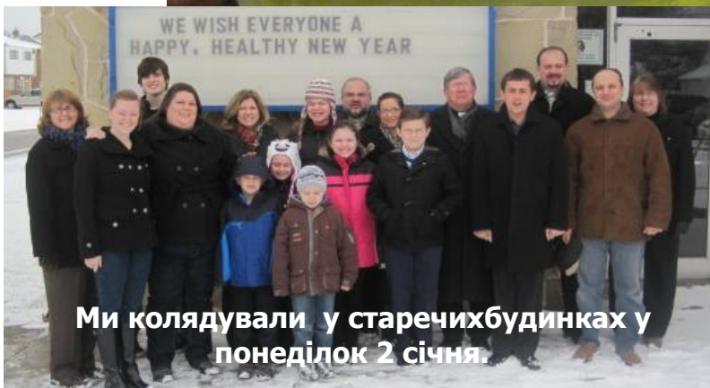
Ми колядували у старечихбудинках у понеділок 2 січня.