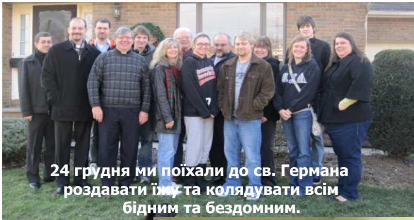
24 грудня ми поїхали до св. Германа роздавати їжу та колядувати всім бідним та бездомним.

Святий Атаназій Великий, архієпископ Александрійський (298 — 373 рр.) «Бог створив людину і забажав, щоб вона перебувала в нетлінні. Але люди занедбали цей дар та ухилились розумом своїм від Бога. Вони зупинились думкою на злomu і, прийнявши зло в себе, підпали під смертне осудження, яким спершу перестерігав їх Бог, і вже не залишилися такими, якими були створені, бо як надумали, так і піддалися розтлінню. Тоді смерть запанувала та оволоділа ними, тому що переступ заповіді повернув їх у природний стан, щоб так як створені були з нічого, так і буття їхнє знову повернулося в прах. Якщо ж люди підпали під природне тління і втратили благодать Божого образу, то що могло інше звершитися або в кому іншому була потреба для повернення первісної благодаті відновлення людей, окрім Самого Бога-Слова, Який із нічого створив весь всесвіт на початку? Йому належало і тлінне привести знову в нетлінне, і зберегти те, що було найдорожчим для Отця. Оскільки Він — Отче Слово і вище всіх: то природнім чином Він один тільки міг усе відтворити, Він один йшов до того, щоб за всіх постраждати і за всіх бути заступником перед Богом Отцем.»