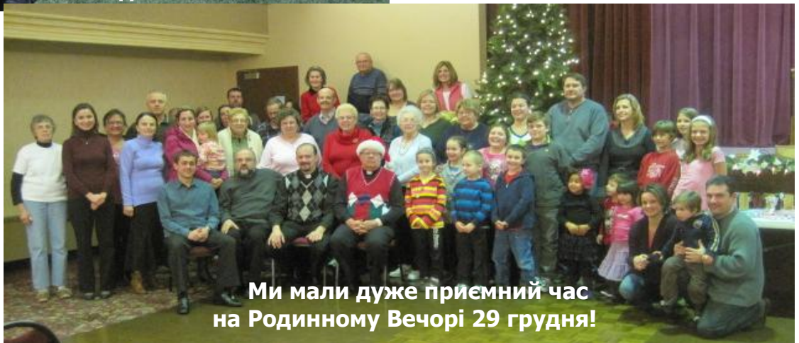
Ми мали дуже приємний час на Родинному Вечорі 29 грудня!