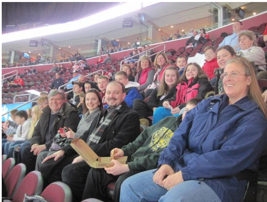
Молодший Відділ УПЛ, вівтарні прислужники разом з батьками були на хокейній грі Lake Erie Monsters у неділю 12 лютого.